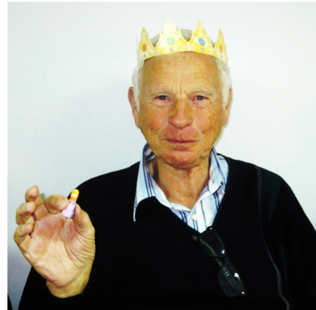
König Guus I – Er hat die Königsfigur im Roscón del Reyes gefunden. Von El Ángel leider kein Foto.

Unsere Gottesdienste zum Gebetstag um die Einheit der Christen - vorbereitet von Christen in der Karibik. Ein Thema u.a.: Die Ketten der Skaverei fallen (Bild unten) am 18.01.18 in der Norwegischen Seemannskirche in Calahonda (engl. – span. - deutsch) am 20.01.18 in El Morche am 21.01.18 in El Ángel am 21.01.18 in der Kathedrale in Malaga am 22.01.18 in Elviria